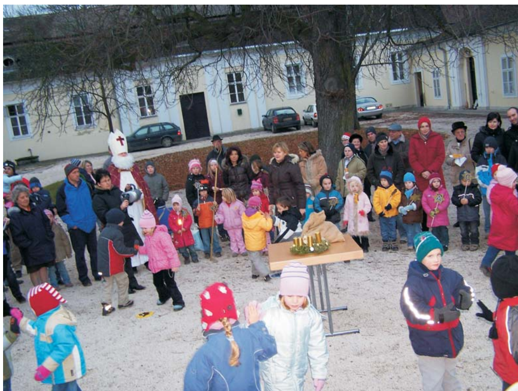
Advent im Schloss: Die Kinder des Wilfersdorfer Kindergartens haben dem Nikolaus einen Tanz vorgeführt.