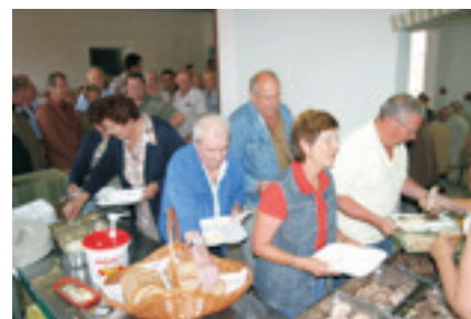
Stockfleisshessen beim Hoffest in Ebersdorf