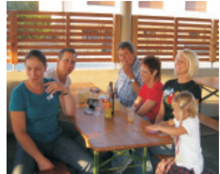
Einige Bewohner der Wohnungen und Reihenhäuser in der Kellermannstraße

Nach Fertigstellung der Wohnbauten und Reihenhäuser in Hoberndorf und Wilfersdorf lud der Bürgermeister zu einem Kennenlernfest.