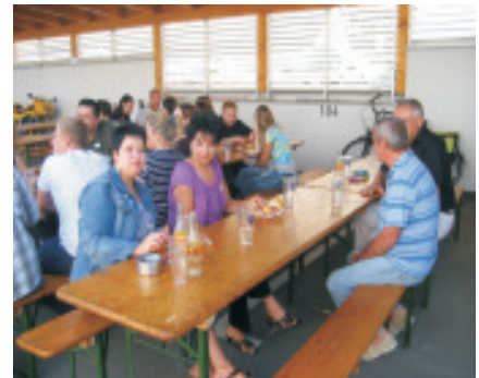
Bewohner der Wohnhäuser in der Wienerstraße