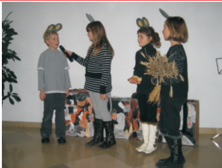
Die Kinder der Volksschule spielten beim Advent im Schloss das Stück: "Was sucht die Maus in Bethlehem?"