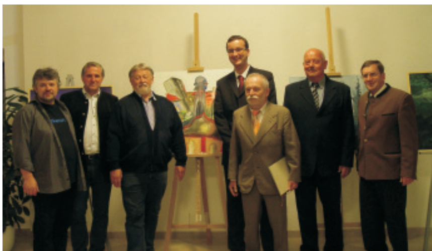
Vernissage der 10 Künstler: