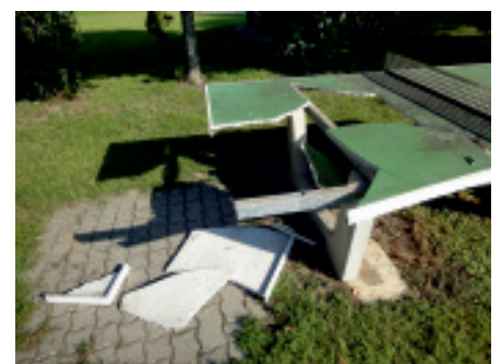
Das war einmal ein Tischtennistisch am Spielplatz Hobersdorf

Die Gemeinde appelliert an die Jugend ihre Aggressionen zu unterlassen und diese sinnvoll auszuleben. Die Bevölkerung wird gebeten, ihre Augen offen zu halten und nicht davor zurück zu schrecken, die Täter anzusprechen oder der Polizei und der Gemeinde zu melden.