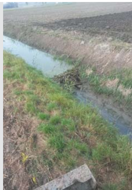
Der Schenkausgraben in Bullendorf muss wegen Biberaktivitäten geräumt werden.

Alle Gemeindebürger werden eingeladen, diverse Wahrnehmungen im Zusammenhang mit Bibern der Gemeinde oder einem der Zaya-Wasser-Verband-