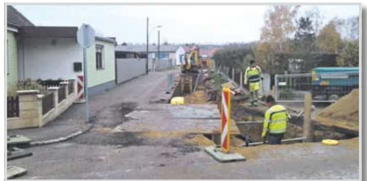
Ende Oktober wurde mit den Bauarbeiten für die Ver- und Entsorgungsleitungen begonnen, die bis Jahresende abgeschlossen sein sollen.