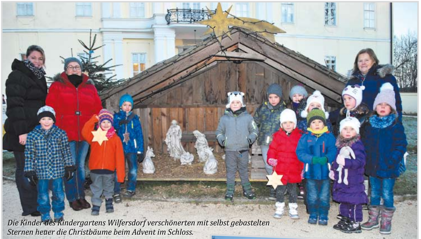
Die Kinder des Kindergartens Wilfersdorf verschönerten mit selbst gebastelten Sternen heuer die Christbäume beim Advent im Schloss.

Der Bürgermeister, die Bediensteten und die Gemeinderäte wünschen ein ruhiges, besinnliches Weihnachtsfest und viel Glück und Gesundheit im neuen Jahr.