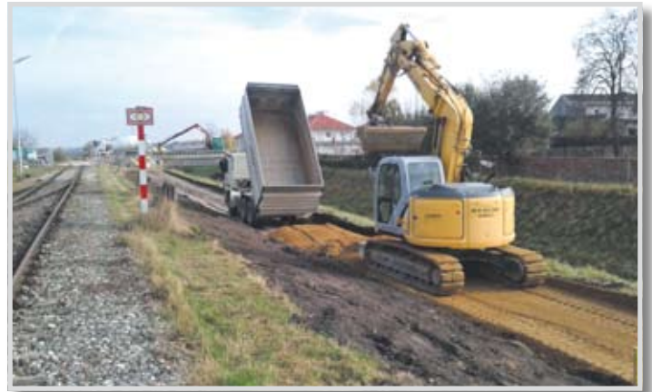
von der Wienerstraße zur Zayastraße errichtet. 2017 soll der Weiterbau in Richtung Westen bis zur Autobahn erfolgen.