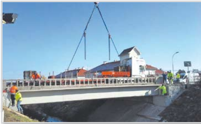
Die Brückenbauarbeiten für die neue Radwegbrücke über die Zaya sind abgeschlossen. Ebenso wurde ein Radweg