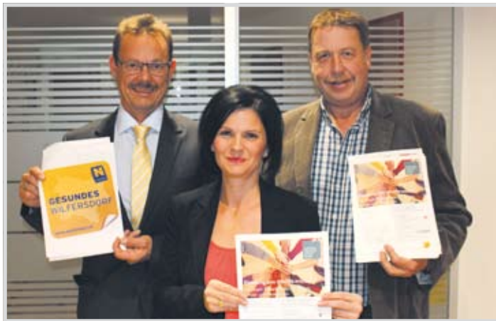
26. November fand im Gemeindezentrum der kostenlose Info-tag mit Experten für Eltern, Kinder und Pädagogen statt.