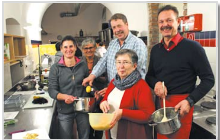
„Gesundes Kochen im Alltag“ konnten am 29. November die Teilnehmenden anhand der Praxis erlernen.